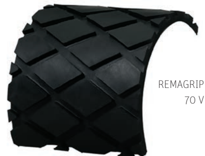
REMAGRIP 70 V