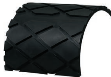
REMAGRIP 70 - SL