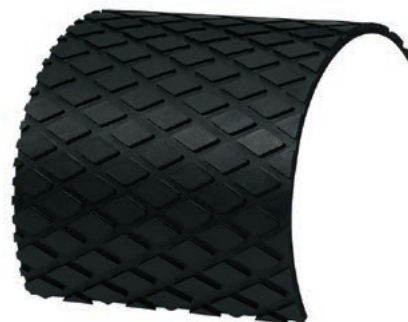
REMAGRIP 60 ÖL